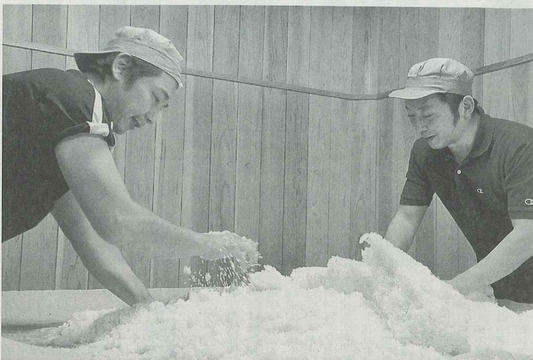
蒸して一晩冷ました酒米を一粒ずつほぐす